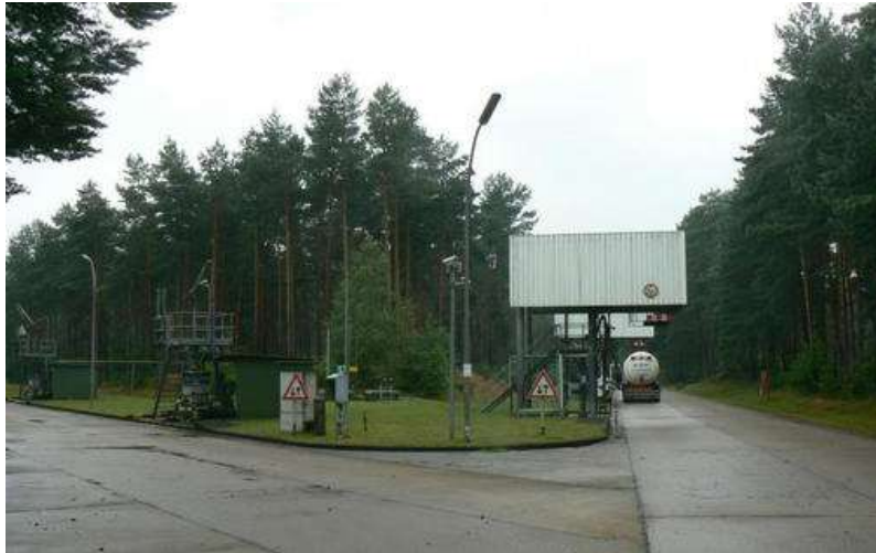
Afbeelding 3: Een CEPS-depot

Het CEPS, met alleen al in West-Duitsland een totale lengte van 2500 kilometer, bestond trouwens niet alleen uit pijpleidingen. Op meerdere plaatsen bevonden zich ondergrondse opslagtanks. Tanklager Oldenburg en tanklager Bramsche lagen gunstig voor het Nederlandse legerkorps. De hierin opgeslagen voorraden droegen bij aan de NATO-eis om voor de eerste 30 dagen van een gewapend conflict voorraden in of in de directe omgeving van het operatiegebied beschikbaar te hebben.