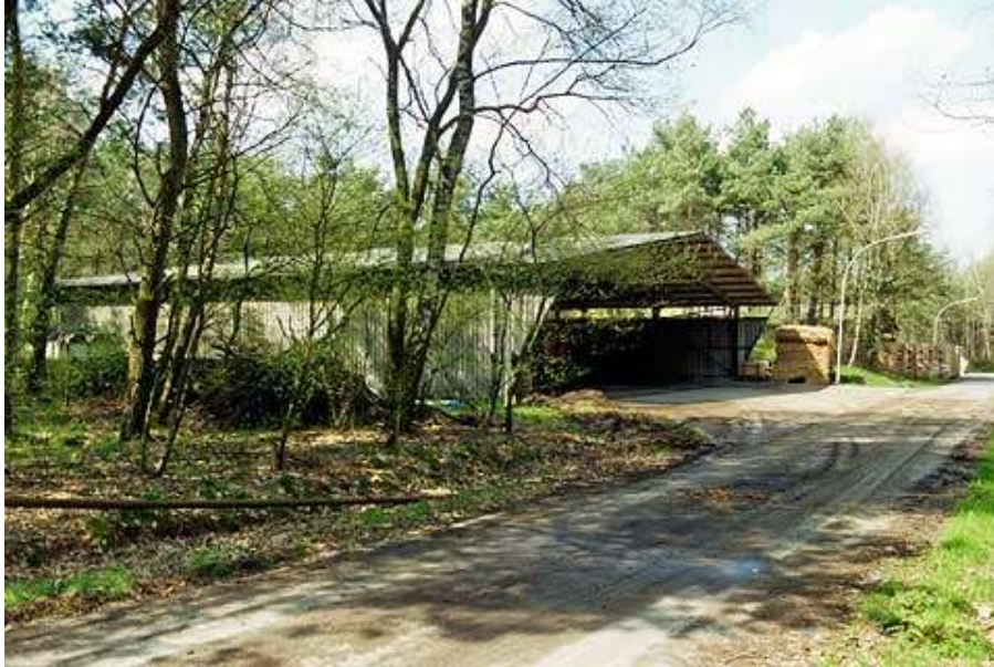
Afbeelding 5: Een van de vele opslagloodsen in Höltinghausen

Daarbij moet de lezer niet vergeten dat de bevoorrading van eenheden ook toen al sterk afhankelijk was van voldoende en adequate transportcapaciteit. En dan moet men zich realiseren dat alle eenheden van bataljonsgrootte en logistiek zelfstandige compagnieën in die tijd ook nog eens de beschikking hebben over eigen bevoorradingspelotons resp. logistieke pelotons met bijbehorende transportmiddelen. Ook toen al, of misschien wel juist toen, was “zonder transport staat alles stil” een bekende en terechte leus. Met de wijsheid van nu zou je kunnen zeggen dat het kadermilitieleger een uitermate adaptieve krijgsmacht avant la lettre was. De krijgsmacht kon gebruik maken van een bijna onuitputtelijke voorraad jonge mannen. Werving had toen een andere lading.